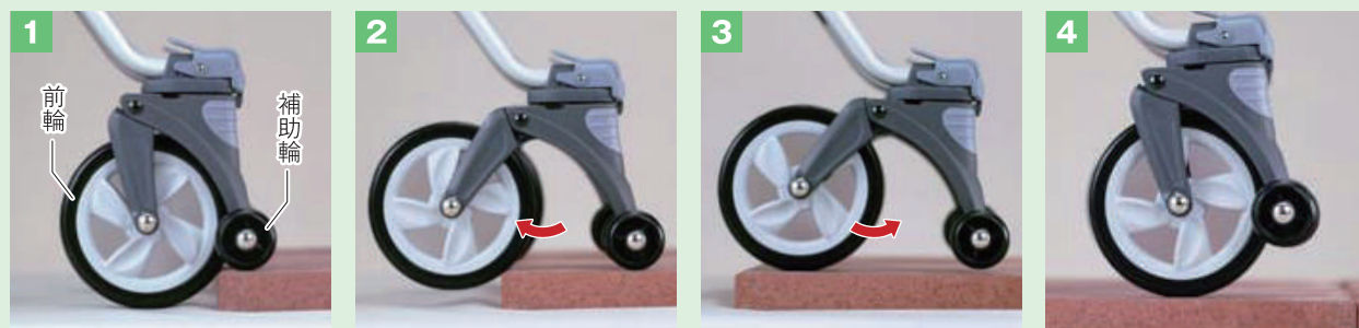
1 補助輪が路面の段差(3cmまで)をとらえます。

独自開発した「段差スルー機能」を搭載した「キャリアースルーン」は すぐれた走行安定性と車体の軽量化を同時に実現しました。 ショッピングでも、お散歩でも、どこにでもお供をする あなたの新しいパートナーです。