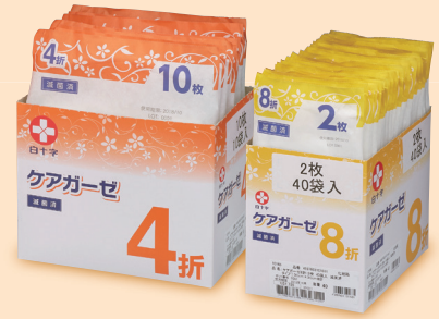
折り方・枚数をわかりやすく表示

高品質なガーゼを患者様にお使い頂く為に、この新しい製法で織布した医療ガーゼ、「ケアガーゼ」をご提案致します。