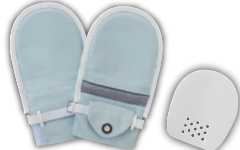
手のひら側 甲側 保護パッド

2枚入 M 8,470円 (税込) 7,700円 (税別) M 550円 (税込) 500円 (税別) L 9,020円 (税込) L 605円 (税込) 8,200円 (税別) 550円 (税別)