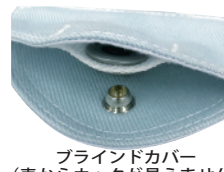
ブラインドカバー (表からホックが見えません)