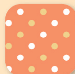
ドット柄 オレンジ