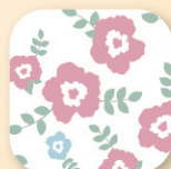
フラワー柄 ピンク