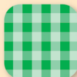
チェック柄 グリーン