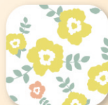
フラワー柄 イエロー