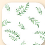
リーフ柄 グリーン