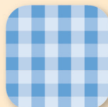
チェック柄 ブルー